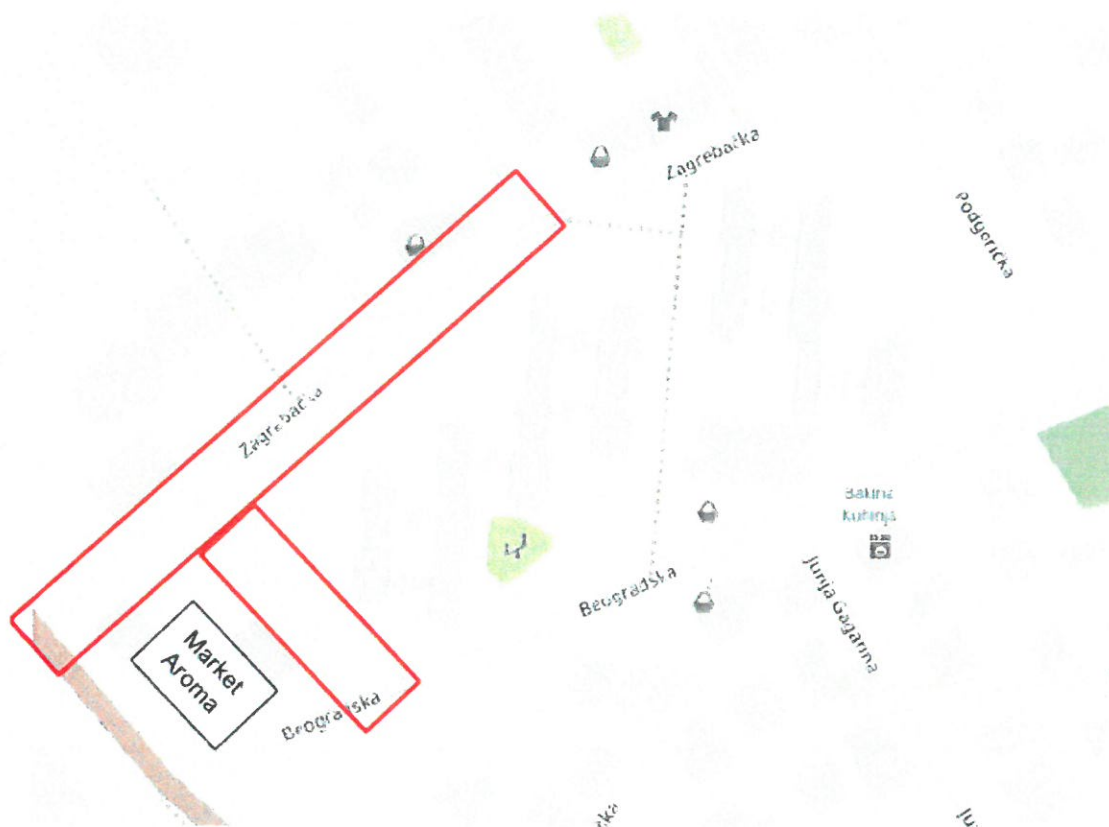
Slika br. 1.1: Granica zahvata dopune elaborata: ul. “Zagrebačka” i ulica iza marketa “Aroma” koja spaja ul. Beogradsku i Zagrebačku

U tački 3. ANALIZA POSTOJEĆEG STANJA U GRANICAMA ZAHVATA, vrši se dopuna, na način da se nakon stava 1, dodaje stav 2 koji glasi: